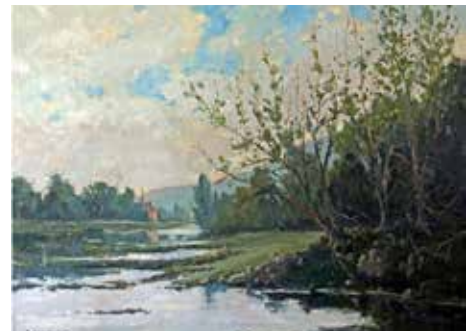
René DEMARCIN, La Meuse en chômage

Il s'agit de numériser ces oeuvres artistiques dans le but de présenter un musée virtuel , sous forme d'un montage.