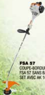
FSA 57 COUPE-BORDURE SUR BATTERIE FSA 57 SANS BATTERIE NI CHARGEUR 159€ SET AVEC AK 10 ET CHARGEUR AL 10 269€