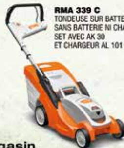
RMA 339 C TONDEUSE SUR BATTERIE SANS BATTERIE NI CHARGEUR 349€ SET AVEC AK 30 ET CHARGEUR AL 101 529€