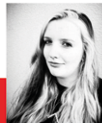
Madleen Fontaine Communication

Infos : ☎ 0478 074 390 @usc.yvoir@gmail.com ✉ 37 Rue Sauvegarde - 5530 Yvoir