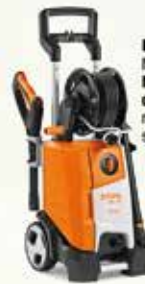
RE 130 PLUS NETTOYEUR HAUTE PRESSION Nettoyeur de surfaces RA 110 inclus d'une valeur de 82€ pour le nettoyage rapide et sans projections de grandes surfaces 624€ 439€