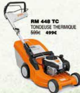
RM 448 TC TONDEUSE THERMIQUE 599€ 499€