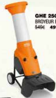
GHE 250 BROYEUR ELECTRIQUE 549€ 499€