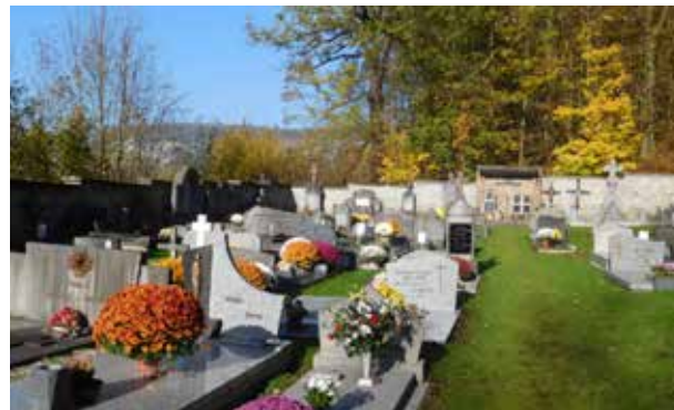
Le cimetière de Houx verdurisé en 2017

C'est pourquoi, nous « verdurisons » progressivement nos anciens cimetières, comme déjà à Durnal, Houx et Dorinne. Et c'est Godinne qui verra, dans la seconde quinzaine d'avril, son cimetière devenir vert, dans le cadre du Plan Maya. Consultez notre page Facebook ou notre site web pour connaître les dates car le cimetière sera fermé durant les travaux. Merci de votre compréhension.