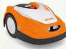
RMI 422 TONDEUSE ROBOT 4099€ 999€