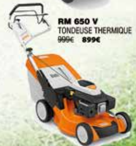
RM 650 V TONDEUSE THERMIQUE 999€ 899€