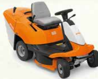
RT 4082 TRACTEUR TONDEUSE THERMIQUE 3499€ 2999€