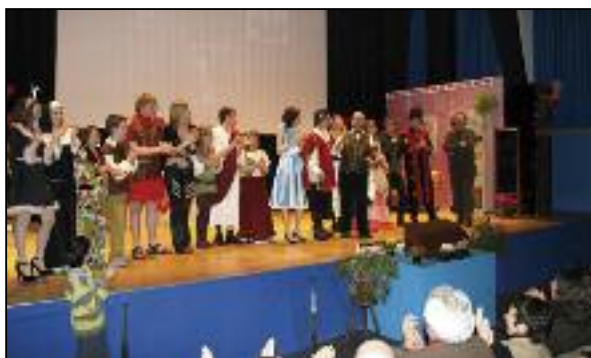
Finale du spectacle joué en 2008 "Atout Cœur"