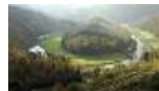
Le tombeau du géant

De Bouillon à Rochehaut, nous visiterons la plus belle partie de la vallée de la Semois à une période où le climat est encore doux et l'affluence déjà moindre.