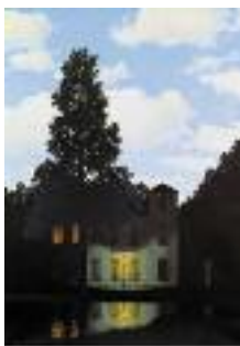
L'Émouvoir des Lumières

Erratum : Attention, le n° de compte mentionné dans le bulletin communal précédent est erroné. Le seul correct est celui ci-dessus.