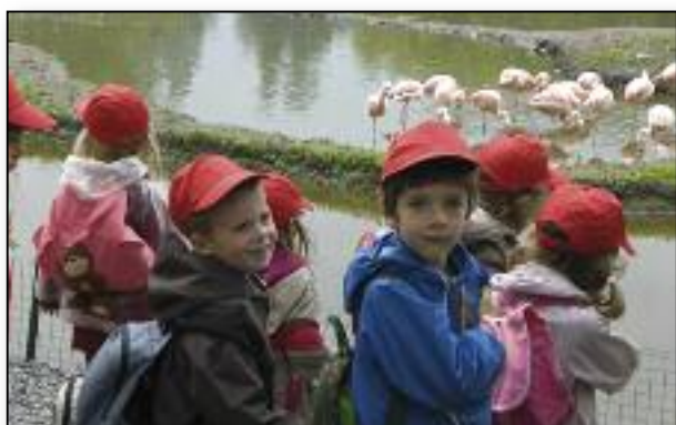
Les enfants de l'école maternelle de Godinne